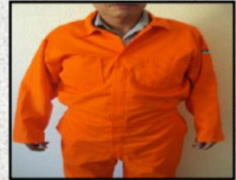
Dos bolsillos en el pecho