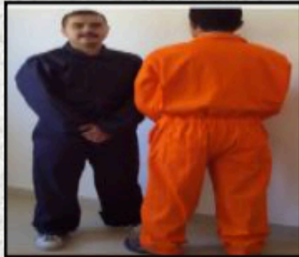
Elástico en la parte posterior de la cintura, dos bolsillos debajo de la cintura en la parte posterior, uno de ellos con broche