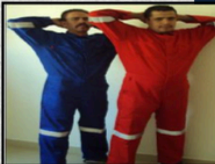
Cierre de metal con broches en cintura y cerca del cuello como refuerzo cubiertos con solapa