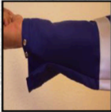
Mangas con 2 broches en muñecas para mejor ajuste