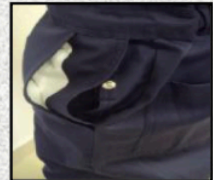
Dos bolsillos laterales, uno con acceso a la ropa interior